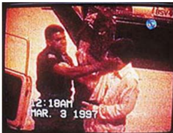
Figura 3 - Favela Naval 6