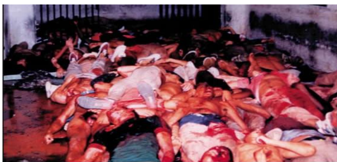
Figura 1 – Carandiru 4

A parábola de Jesus Cristo em Mateus 9:16 - “Ninguém deita remendo de pano novo, em veste velha, porque semelhante remendo rompe a veste e faz-se maior a rotura” – foi novamente comprovada, tem-se durante a década de 90 inúmeros episódios de repercussão internacional envolvendo as polícias brasileiras, colaciona-se alguns casos envolvendo a Polícia Militar, inclusive a do Estado do Pará: