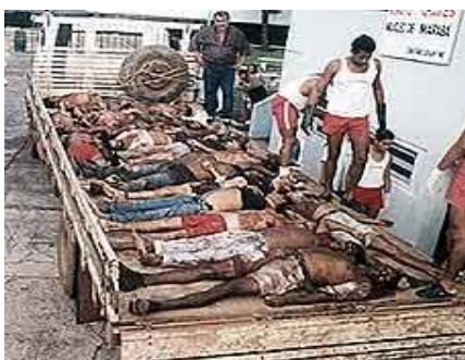
Figura 4 - Eldorado dos Carajás 7

Somente no final dos anos 90 surge a reflexão sobre um novo modelo de polícia no Estado Democrático de Direito, começa-se a estudar as polícias nas sociedades com uma tradição democrática fortalecida. Surgem estudos que apontam os modelos de polícias do Canadá e do Japão como uma alternativa de controle ao crime, é apresentada a Polícia Comunitária.