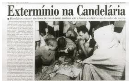
Figura 2 – Candelária 5